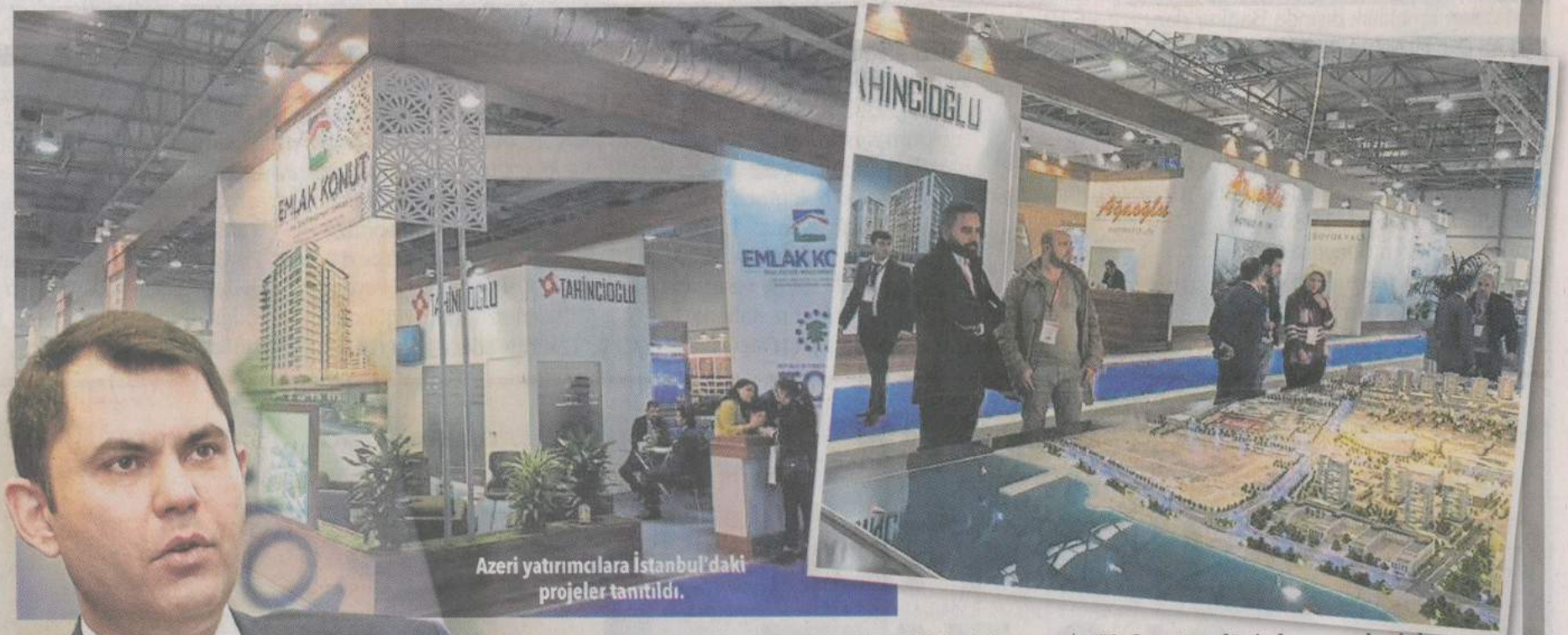
Azeri yatırımcılara İstanbul'daki projeler tanıtıldı.

Emlak Konut GYO Genel Müdürü Murat Kurum, son dönemde dövizde yaşanan yükselişin gayrimenkul sektöründe fırsat yarattığını söyledi